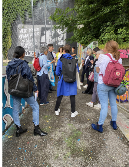
Restitution des ateliers Pousses Urbaines sur le chemin entre la Sallaz et la Rouvraie, juin 2022.

L'équipe de Pousses Urbaines a observé un exemple d'utilisation transversale: les bacs de cultures, présents dans certains établissements scolaires, sont entretenus conjointement par les élèves et les services de la Ville, mais aussi par les habitantes et habitants du quartier, qui prennent le relais pendant les vacances scolaires.