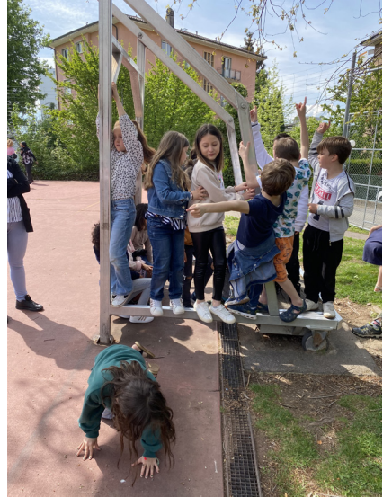
Élèves du collège de la Rouvraie lors d'un atelier Pousses Urbaines, mai 2022.

En ce qui concerne le partage du préau avec d'autres personnes, les enfants n'ont pas vraiment formulé de revendications précises à ce sujet. En revanche, elles et ils sont sensibles à la question du partage de cet espace entre pairs (et particulièrement entre filles et garçons). Certains groupes ont même émis quelques réserves à l'idée que l'on s'approprie leur espace. Parmi les réticences formulées se trouvent la gestion des conflits d'usages et d'éventuelles incivilités ainsi que la maîtrise des déchets.