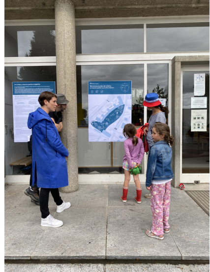
Restitution des ateliers Pousses Urbaines au collège de la Sallaz, juin 2022.